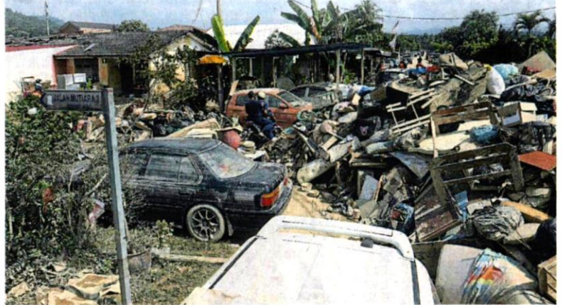
■灾区满街尽是居民丢出的各式垃圾，数量多得惊人。

达鲁益山集团废料管理公司(KDEBWM)周五，在莎阿南第21区的固体废料转运站，展开大型垃圾卸货工作。