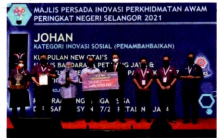
New Otai's dinobatkan sebagai johan bagi Kategori Inovasi Sosial (Penambahbaikan).

Majlis juga melancarkan penggunaan aplikasi web portal OSHE untuk pemantauan kontraktor di bawah projek-projek Majlis dan pelaporan ICIX (I See I Act) oleh kakitangan bagi memastikan persekitaran tempat kerja selamat dan kondusif.