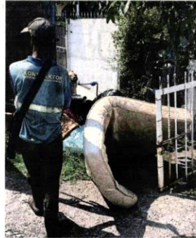
■清理 居住区堆积许多垃圾, 清洁员工也忙于收拾