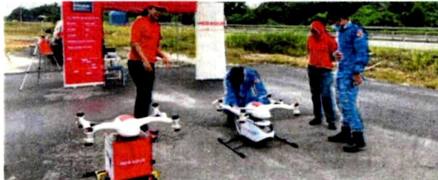
Dron digunakan bagi menghantar bekalan kritikal seperti ubat-ubatan, makanan dan 'powerbank' di beberapa kawasan sekitar Selangor.