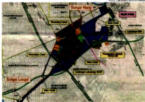
Perancangan projek Bandar Terusan pernah dibuat pada tahun 2007 sebelum dibatalkan semasa peralihan kuasa kerajaan negeri pada tahun 2008.