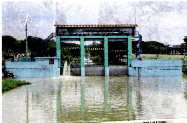
Pintu air di Taman Sri Muda, Seksyen 25 Shah Alam sudah beroperasi semula walaupun kerja-kerja pembersihan di kawasan itu berdepan kesukaran sejak Selasa.

kanaan dibeli sebuah syarikat pemaju, yang kemudiannya membangunkan kawasan terbabit pada 17 Februari 1982 sebelum dibuka secara rasmi pada tahun 1991.