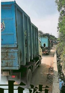
垃圾车在车龙中排队进入垃圾土埋场。

(巴生24日讯)灾后垃圾量惊人,导致进出垃圾土埋场的垃圾车和罗里络绎不绝,早出现了交通大堵塞的“车龙”景象! 雪州上周末连续不断的暴雨,州内多个县市引发大洪水,其中重灾区包括沙亚南太子园、第13区、巴当爪哇、巴生港口、美拉华斯花园、圣淘沙、甘榜爪哇、巴生卫星市、武吉拉惹镇、士文达、乌冷等地,受影响灾户非常多,尤其水淹到膝盖以上的地区,许多家具、床褥、家电、衣物、家庭用品都浸泡在水中报废或损坏,不得不丢弃。 也因此,重灾区这几天最常看到的“景观”就是垃圾堆,无论是住家外、大路旁或空地都充斥着许多垃圾,惟也引发环境卫生或邻里纠纷。 巴生市议会于灾后积极安排人手前往灾区清理垃圾,不过由于最近的垃圾量实在惊人,当局预计需耗几天或几周时间,才能全面清理干净所有灾后堆积的垃圾。 由于地方政府也积极派员在清理垃圾,也有一些志工团体借出垃圾槽协助灾民丢弃垃圾,造成这几天进出垃圾土埋场的罗里和垃圾车非常多,惟因土埋场出现车龙,都需要“排队”等待丢弃垃圾,间接也影响到承包商回收垃圾的次数,恐清理垃圾的时间会持续拉长。