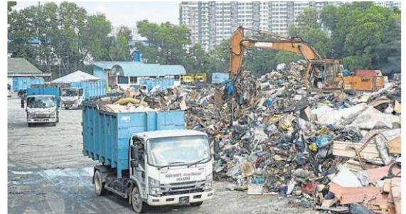
■连绵大雨导致雪州多个县市引发大洪水，灾后垃圾量惊人，导致进出垃圾土埋场的垃圾车和罗里络绎不绝。

他指出，目前，雪州大型的垃圾土埋场有瓜雪而梳土埋场、丹绒12和乌鲁武吉达卡土埋场，有能力应付近期暴增的垃圾。