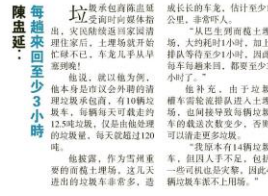
有些地区甚至出动吊钩才能清理堆满的垃圾。