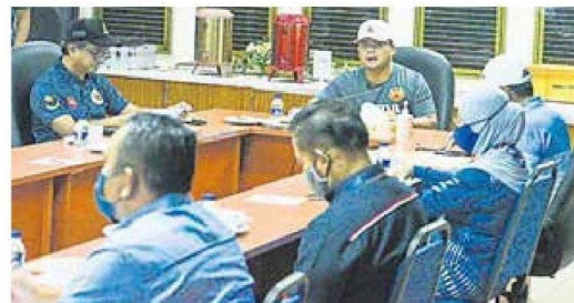
■在跟进各单位救灾的进度。大臣阿米鲁丁（中）