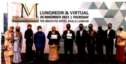
MBPJ turut menerima Anugerah Gold Class 1 sempena 39th MSOSH Award 2021 Ceremony.