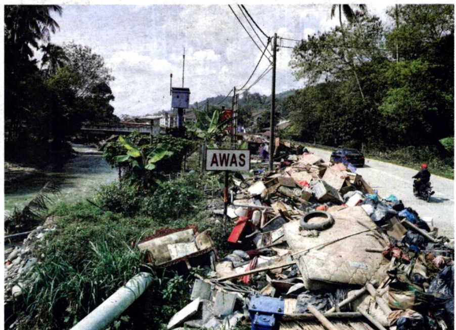
TIMBUNAN sampah akibat bencana banjir juga dapat dilihat di sepanjang jalan dari Batu 12 hingga ke Batu 18 Hulu Langat berikutan kelewatan pihak berkuasa mengutip dan melupuskannya.

Tempat letak kereta sekitar rumah pangsa dan tepi jalan di kawasan rumah yang terjejas teruk dengan banjir besar selama lima hari itu, menjadi tem-