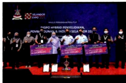
Pasukan Inovasi MBPJ, Iron Squadron meraih kemenangan menerusi pelbagai kategori yang dipertandingkan menerusi Anugerah Inovasi Negeri Selangor 2021.

Majlis akan terus berusaha untuk memperkukuhkan lagi budaya inovasi ini bagi menampilkan lebih banyak idea baru