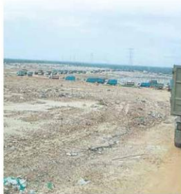
■由于灾后的垃圾量暴增，进出垃圾土埋场的垃圾车大堵塞。

(巴生24日讯)雪州上周末连绵不断的暴雨，州内多个县市引发大洪灾，结果灾后垃圾量惊人，导致进出垃圾土埋场的垃圾车和罗里络绎不绝，罕见出现了交通大堵塞的“车龙”景象。