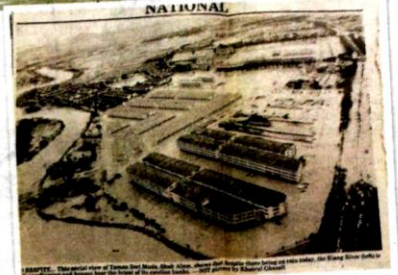
Impak pembangunan tidak terancang di kawasan Taman Sri Muda, Seksyen 25 Shah Alam menyebabkan ribuan penduduk kawasan itu kini terjejas teruk akibat banjir besar di Lembah Klang, hujung minggu lalu.

Selain itu, masalah banjir kilat kerap berlaku termasuk peristiwa banjir besar Sri Muda sekitar tahun 1995, sehinggalah Menteri Besar Selangor ketika itu, Tan Sri Muhammad Muhd Taib mengambil inisiatif membina benteng sungai, kolam takungan banjir bernilai RM40 juta serta pembina-