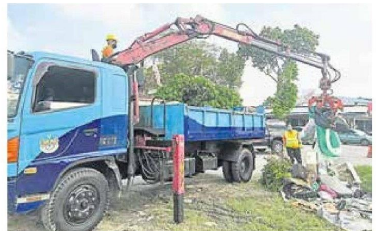
■ 区清理垃圾。市议会积极调派人手到各灾

理垃圾堆,包括有准备垃圾槽供民众丢弃垃圾,只不过原定一天可以载走来回6趟,但因为而榄垃圾场进出大堵塞,所以只能减少到1天3或4趟,所以要清理完垃圾还需要更长时间。