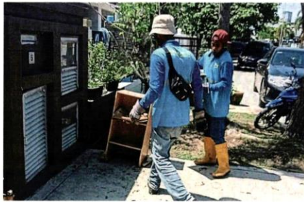
■向灾民收费。 垃圾清洁员工都是免费为灾民服务, 不可以