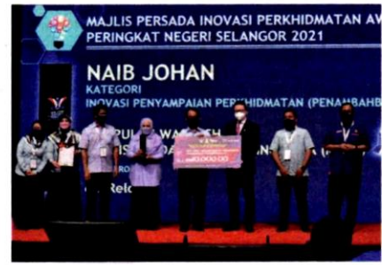
Wastech turut cemerlang di kedudukan naib johan bagi Kategori Inovasi Penyampaian Perkhidmatan (Penambahbaikan).